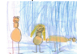
von: Simon S.

Fritzchen und seine Freundin gehen spazieren. Die Freundin sieht einen Hund und sagt: „Oh, wie süß!“ Da sagt Fritzchen: „Hast du ihn denn schon probiert?“