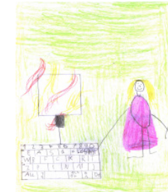
von: Simon S.

Was macht die Blondine, wenn der Computer brennt? - Die Löschtaste drücken.