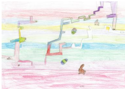
von: Lea S.